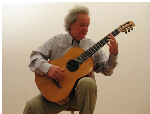
Carlo DOMENICONI, guitariste virtuose italien

Comme le montre la photographie ci-dessous, pour modifier la hauteur du son émis, le guitariste appuie sur la corde au niveau d'une case de façon à modifier la longueur de la corde utilisée. Des pièces métalliques, nommées frettes, délimitent les cases sur le manche de la guitare.